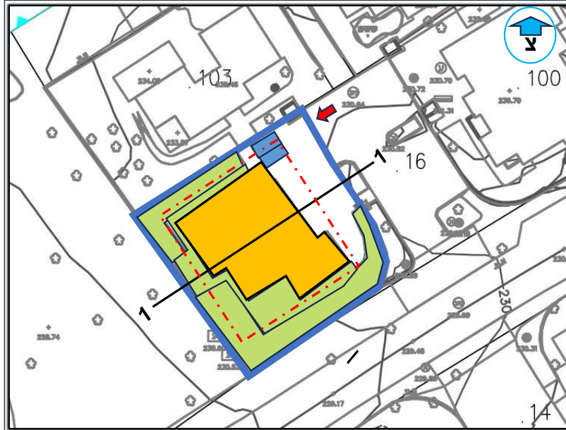
תכנית קומת קרקע

הערה: יש להציג תכנון קומת קרקע+ תכנון קומה א' במידה ומדובר בבקשה לתוספות בניה נדרש לסמן את התוספת המבוקשת בתכנית, בחתכים ובחזיתות.